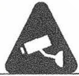
මෙම පරිශ්‍රය තුළ CCTV කැමරා ක්‍රියාත්මකයි